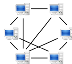
figura 1 - tipo de red p2p. Imagen de Mauro Bieg, bajo licencia Pública General.

La figura 1 muestra un tipo de red p2p. En la misma, se observa la característica propia del modelo y su dinámica, donde el intercambio se ejecuta sin necesidad de nodos que actúen como servidores fijos (donde se alojan los archivos). Justamente el diferencial radica en que cada computador o dispositivo (nodo de la red) es cliente y simultáneamente servidor. Esto significa que el dispositivo de un usuario puede descargar material alojado por otro usuario y, a su vez, servir de fuente de descarga para los restantes miembros.